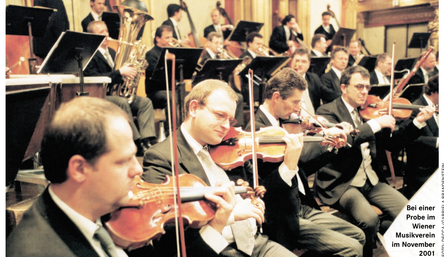
Bei einer Probe im Wiener Musikverein im November 2001